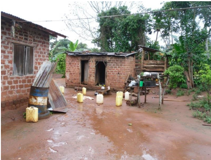
Här bodde jag på Bussi Island

väska med mina kläder och andra tillhörigheter skulle hamna på villovägar må vara egalt men radioprylarna? Ve och fasa! Som vanligt var jag lite nervös inför att passera tullen trots att G3RWF hade gjort sitt bästa för att lugna mig. Tullpersonalen på flygplatsen satt och läste utan att ta minsta notis om hela vår grupp när vi traskade igenom så Nick hade helt rätt i sina antaganden att min oro var helt obefogad. Visum fixades på plats för $50 och så var vi inne i landet. Tyvärr så var arbetschemat minst sagt pressat, redan tredje dagen skickades jag och fem andra ut till Bussi island som ligger en bra bit ut i Lake Victoria för att tillbringa tre dygn hos några bofasta familjer; Bussis 20000 invånare saknar i stort sett all infrastruktur självklar för oss såsom elström, vatten, avlopp, vägar och sjukvård. Jag gav i stort sett upp hoppet om att komma igång på radion, tiden nog inte skulle räcka till.