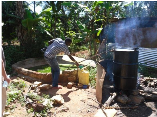
Ugandisk homebrew på Bussi Island

SM kom i loggen vilket är rätt bra med tanke på det ringa antal QSO jag körde. Då jag enbart körde telegrafi finns ett antal SCAG-medlemmar, bl.a. vår ordförande SM6CTQ, bland detta 40-tal SM.