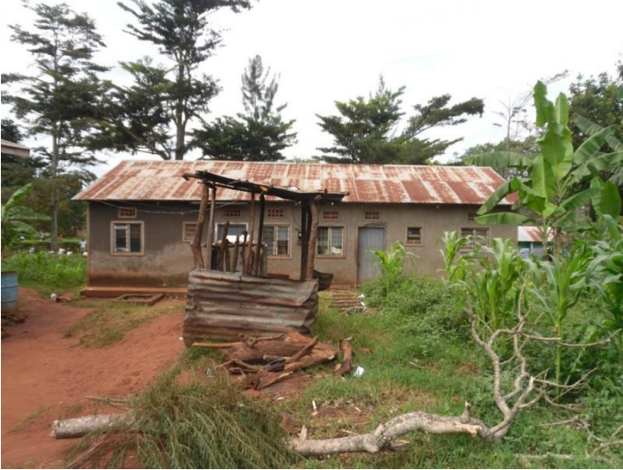
Läraryrsläggning på Ngogwe

Onsdagen den 16 oktober var jag så åter i Entebbe och med nästan ett dygn ledig tid att spendera på bästa sätt var snart min station återupprättad och jag var åter i luften. 5X8EW var fortsatt populär och fram till att jag gick QRT för gott tidigt på morgonen den 18 oktober blev det ytterligare 550 QSO loggade, samtliga på CW. Jag gjorde faktiskt ett försök i SAC SSB från Uganda, hörde flera stationer, bl.a. OH0R, med fina signaler på 20m men trots idogt ropande var det ingen som uppmärksammade mig, antar att folk hade sin antenner mot andra håll än söderut. (Där gick ni bet på en multiplier samt en unik chans att få köra mig på annat än telegrafi!)